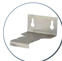
Wandhalter aus Edelstahl