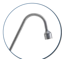
Auslaufrohr aus Edelstahl mit M22-Gewinde