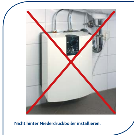
Nicht hinter Niederdruckboiler installieren.

Filtersysteme dürfen niemals hinter einem Niederdruckboiler (druckloser Boiler oder druckloser Durchlauferhitzer) installiert werden!